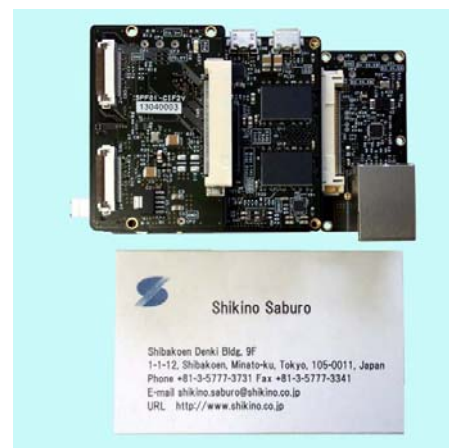
大きさは名刺サイズ